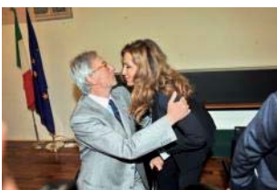
DANIELA SANTANCHE VITTORIO FELTRI

PS - Si susseguono le indiscrezioni sul rapporto andato in rovina tra Feltri e Sallusti. Quest'ultino, ormai legato al sottosegretario Santadeché, avrebbe un canale privilegiato con Palazzo Grazioli con conseguente scavalco del Vittorioso. Di qui, uno scenario che prevede il ritorno di Feltri a "Liberò", Belpietro alla conduzione di talk-show anti-Santoro con Sallusti solo al comando del giornale di Via Negri.