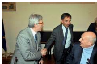
FELTRI LA RUSSA BONDI