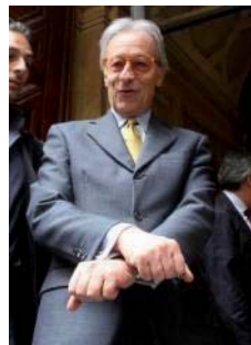
FELTRI SI AMMANETTA

Tra le rivelazioni inaspettate, Feltrusconi ammette che fu lui, quando lavorava al "Corriere", a inventare per il Cavaliere il nomignolo Banana, di cui s'è appropriato Altan per le sue vignette sulla prima pagina di "Repubblica".