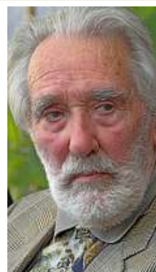
Mario Rigoni Stern (1921-2008)

Il Premio Rigoni Stern per la letteratura multilingue delle