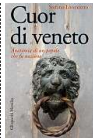
La copertina del libro di Lorenzetto

Qui a fianco pubblichiamo, per gentile concessione dell'editore, un estratto dal nuovo libro di Stefano Lorenzetto, Cuor di veneto. Anatomia di un popolo che fu nazione (Marsilio, 304 pagine, 19 euro). Per capire davvero un luogo bisognerebbe esserci nati. Giornalista, Stefano Lorenzetto, già caporedattore a L'Arena e vicedirettore al Giornale , è veneto, figlio orgoglioso di un popolo che fu per 1.100 anni nazione, e in questo libro ci racconta la controversa regione d'Italia attraverso le storie dei suoi poliedrici abitanti, eredi della