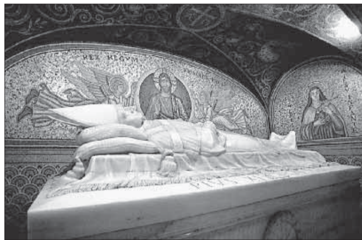
La tomba di Pio XI nelle Grotte Vaticane