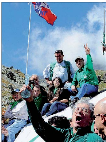
Il Senatùri ieri alle sorgenti del Po

Bossi: «Porteremo i ministeri via da Roma» In Fvg la Lega Nord reclama 3 posti chiave