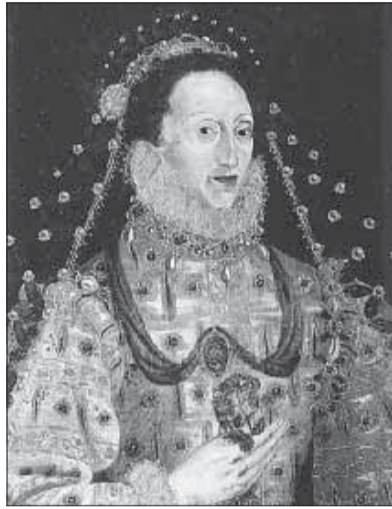
La regina Elisabetta I in un ritratto del 1580

Cranmer che la traspose in una lingua magnifica. D'altro canto essa adotta i due principi protestanti, sola scriptura (la Bibbia del re Giacomo è un successo incomparabile) e sola gratia . Il compromesso elisabettiano deve essere considerato un'opera politica. Non si tratta di definire la verità religiosa, il che al contrario è piuttosto evitato, ma di giungere a una pace fra le fazioni avverse. Essendo stata la regina scomunicata da Roma, l'Atto di Supremazia fa di lei la custode della fede. L'Atto di Uniformità im-