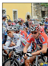
Ciclisti al Giro del Friuli

FIUME Anche la Croazia vuole introdurre le vignette autostradali, seguendo l'esempio della Slovenia. La proposta viene da un gruppo di esperti della facoltà zagabrese di Ingegneria dei Trasporti e dell'Istituto croato per i Trasporti. Lo studio è stato inoltrato al ministero competente. Già pronto il tariffario: si ipotizzano 123 euro per il bolli-ano annuale. Previsti rincarì per i mesi estivi.