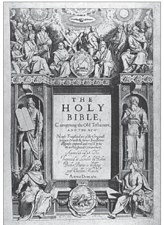
Frontespizio della Bibbia di re Giacomo (1611)

La svolta scettica e critica dell'alto pensiero inglese ha avuto come risultato di allontanare dal popolo le passioni religiose più violente. Dopo tutto queste antiche controversie dogmatiche non hanno importanza se le si guarda con l'ironia della ragione. Joseph de Maistre ha affermato che l'Inghilterra aveva smesso di essere persecutrice quando aveva smesso di essere cristiana. È molto ingiusto, ma non completamente falso. La libertà religiosa che