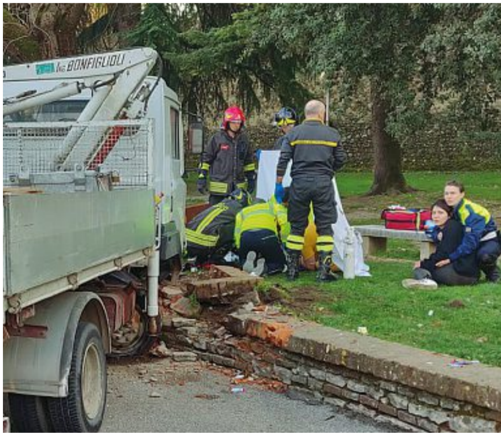
Lo scatto I primi soccorsi al piccolo Thiago, investito dal camioncino di un muratore in fuga dai vigili: la disperazione della mamma

MAROSTICA PARLA LA MAMMA DEL BIMBO ANCORA GRAVE