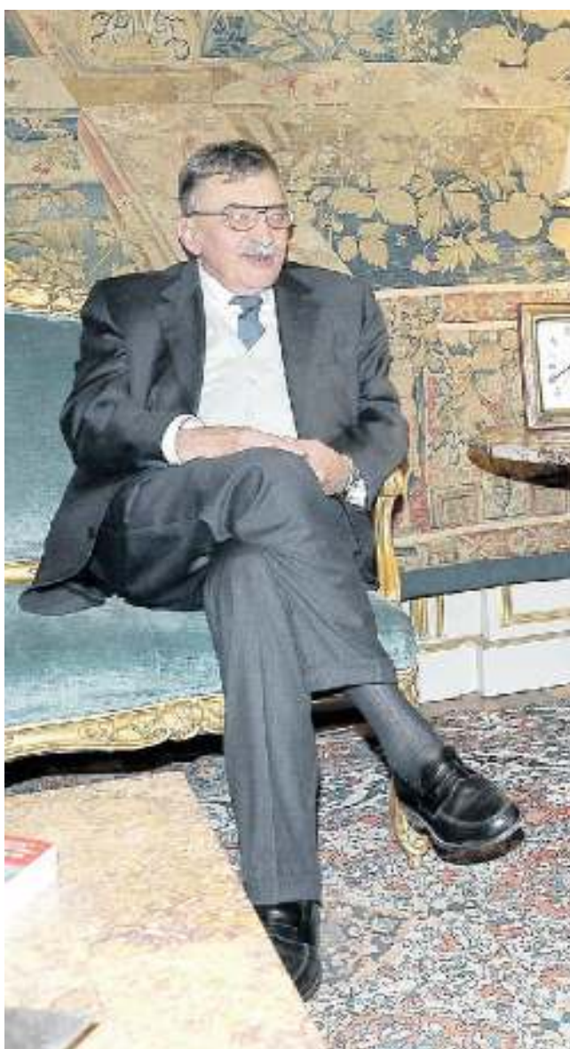
AL QUIRINALE Qui sopra l'editore e scrittore veneziano in attesa di essere nominato Cavaliere della Repubblica nel 2017. A destra ancora in un dibattito a Confindustria; sotto con il filosofo Bernard Henry Levy alla Fenice