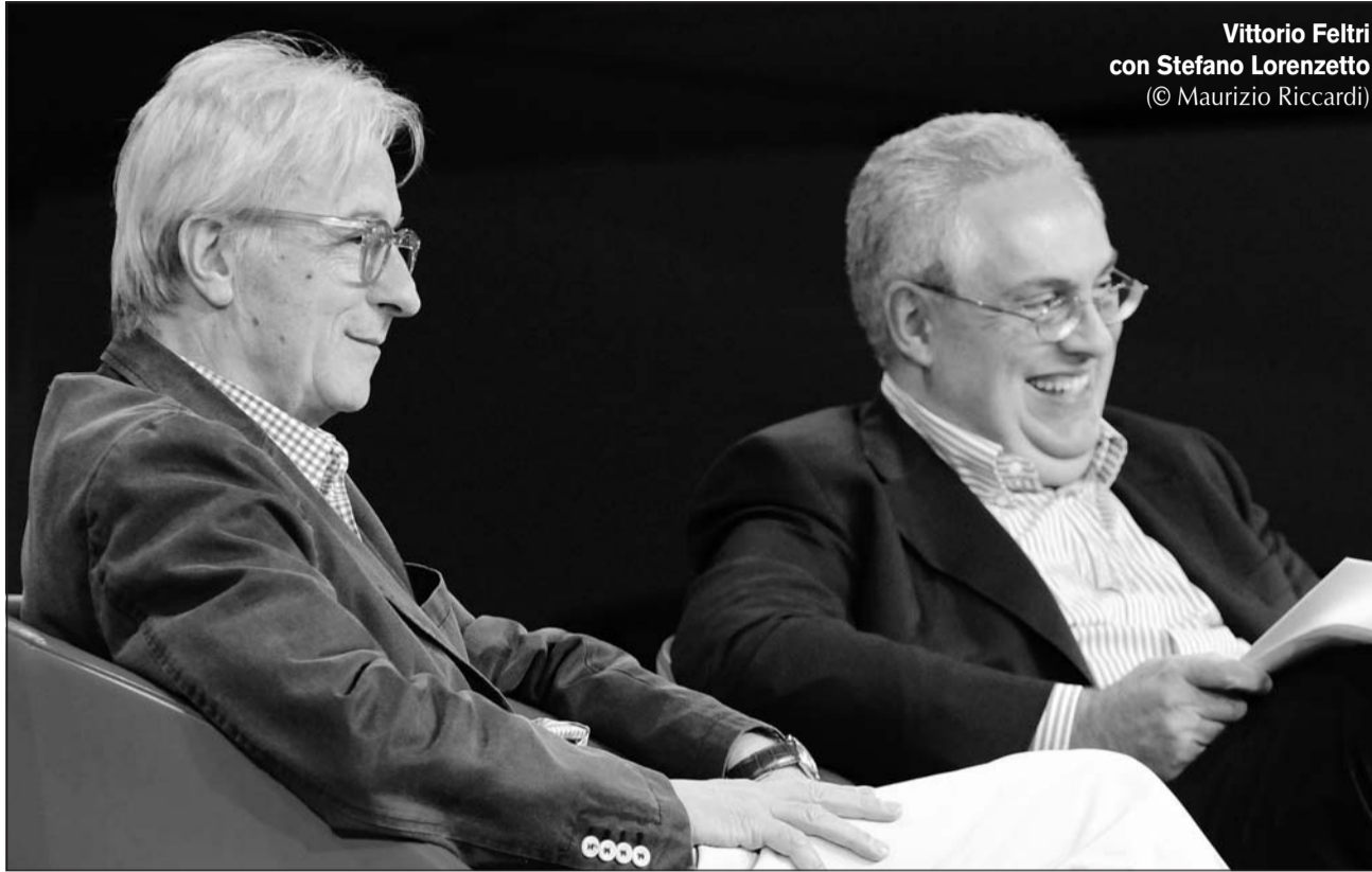
Vittorio Feltri con Stefano Lorenzetto

Mercoledì 24 novembre arriva in libreria Il Vittorioso (Marsilio, 264 pagine, 17,50 euro), una biografia-intervista di Vittorio Feltri, scritta da Stefano Lorenzetto, che ha per sottotitolo Confessioni del direttore che ha inventato il gioco delle copie . Per gentile concessione dell'editore, pubblichiamo l'inizio del capitolo in cui Feltri racconta del suo rapporto con Indro Montanelli.