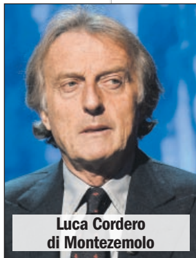
Luca Cordero di Montezemolo

Papa Francesco guadagna un 8, come Benedetto XVI e Giovanni XXIII, mentre a Giovanni Paolo II viene assegnato un 9.