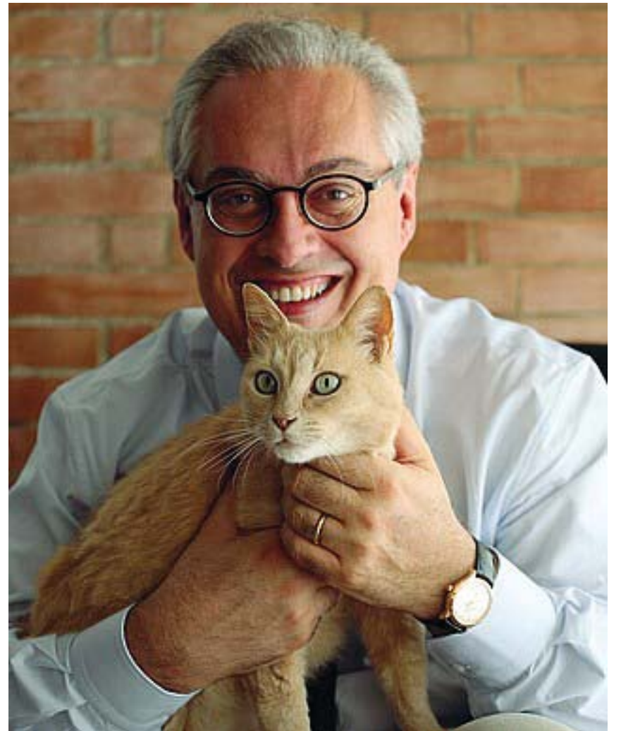
«Nostalgia del Veneto pitocco» Stefano Lorenzetto, autore della serie «Tipi italiani»