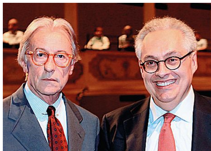
Vittorio Feltri con Stefano Lorenzetto. Nel riquadro il libro

è solo perché fu il primo sovrano dell'Italia unita, quanto piuttosto per lo stuolo di figli illegittimi che il sovrano erotomane, sessualmente superdotato, sparpagliò nei casolari del regno sabauda. Anche Benito Mussolini ne andava pazzo. E Franklin Delano Roosevelt. E John Fitzgerald Kennedy. E Mao Tse-tung. E re Juan Carlos di Spagna. E Bill Clinton. E François Mitterrand. E Valéry Giscard d'Estaing. E Jacques Chirac, soprannominato "10 minuti, doccia inclusa". Persino - chi l'avrebbe mai sospettato? - quella testa da casco di François Hollande ne va pazzo.