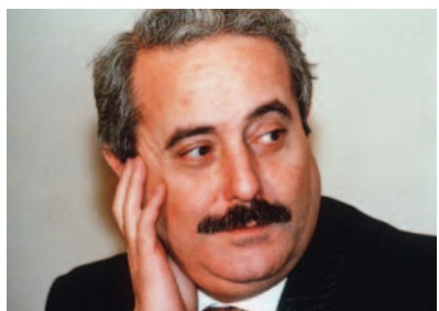
Giovanni Falcone. «Mi portò a parlare al Csm»

Potevo sbagliare per tutta la vita: nessuno ti dice nulla. La Corte d'appello? Basta che hai 40 anni