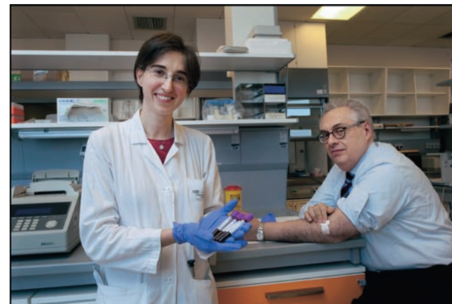
Da queste tre provette di sangue sarà estratto il Dna del giornalista di «Panorama».