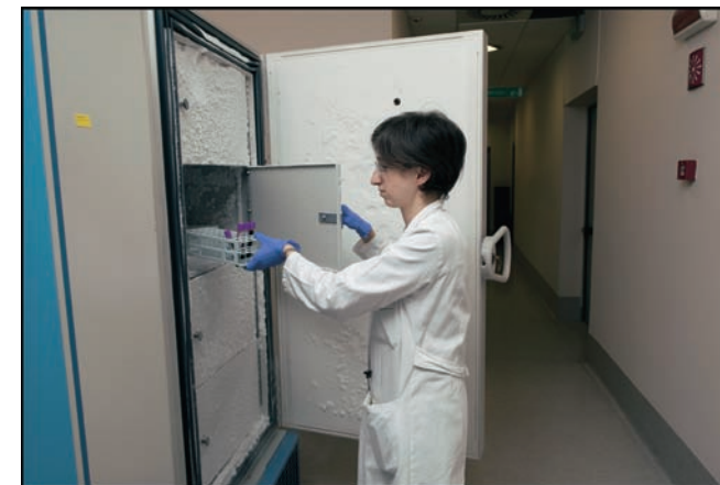
Frammentato il Dna, servono quattro giorni per preparare il campione che sarà sequenziato.