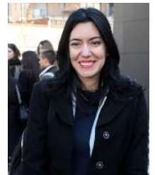
Il ministro Lucia Azzolina

Gli esami di maturità inizieranno il 17 giugno, non ci saranno prove scritte ma un colloquio orale in presenza di un'ora. Tutti saranno ammessi. Solo due le eccezioni: l'assenza di elementi di valutazione nel periodo di lezioni precedente il coronavirus e il caso di provvedimenti disciplinari gravi. Ogni studente avrà una base di 60 crediti mentre gli esami potranno valere fino a 40. Il ministro dell'Istruzione, Lucia Azzolina, avverte: se i dati sui contagi peggioreranno gli esami si faranno, ma a distanza. PAG.3