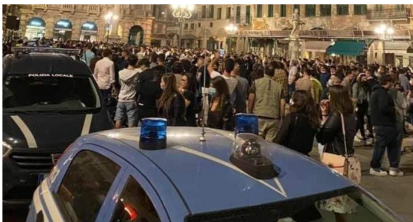
Folla venerdì in piazza Erbe: quanto accaduto ha indotto il sindaco Sboarina a vietare il consumo di alcol in strada • MAZZARA e SANTI PAG.12 e 13

Se una cosa ci ha insegnato questa emergenza è che la ripartenza deve viceversa giocare in chiave di cooperazione, progetto comune e responsabilità. Solo due giorni fa c'è stata la prima riunione dei firmatari della Carta dei Valori a cui hanno aderito tutti i principali soggetti-decisi della città: dalla politica all'economia, dal sindacato all'università. Non elencazione di buoni propositi ma la posa del primo mattone per passare, uniti, dalle parole ai fatti. Cioè portare a termine i progetti fermi da troppi anni e varare sinergie tra i punti di forza del nostro territorio per una nuova idea di Verona che faccia scuola in Italia. Contro questa visione di lungo respiro cozzano le immagini di una città in balia di una movida senza legge.