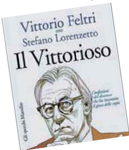
Il saggio «Il Vittorioso»

«Rincontrai Berlusconi il giorno di Ferragosto, sempre a pranzo a casa sua, noi due soli. E lì mi disse che avrebbe voluto avermi con sé, ma non al Giornale, come tutti scrissero. No, mi voleva a Canale 5, con un contratto di direttore, per fare qualcosa. Che cosa, non lo sapeva nem-