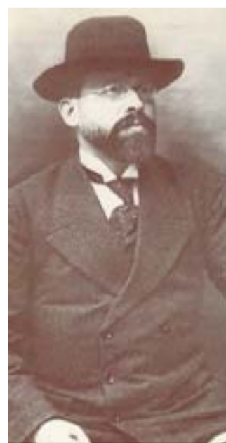
La vita Fu il padre storico del meridionalismo

L'imprenditore trevigiano aveva investito ne «La Voce» 2 miliardi di lire a fondo perduto