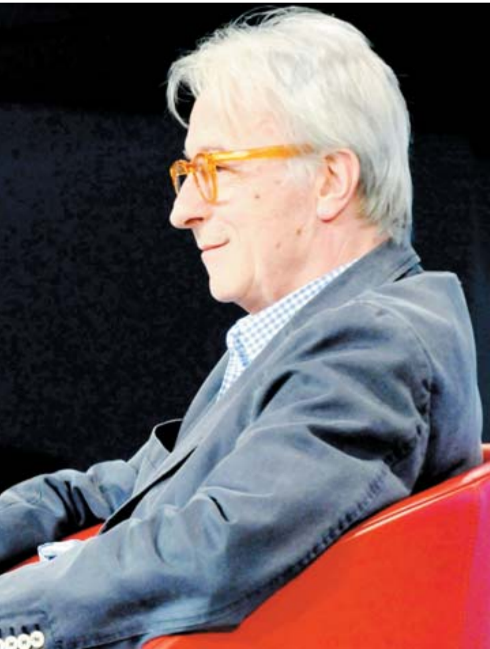
La strana coppia Stefano Lorenzetto e Vittorio Feltri a confronto. In primo piano la vita del giornalista di Bergamo