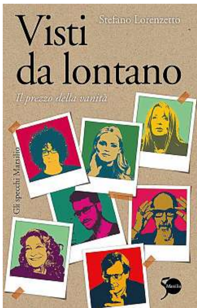
Famosi e vanitosi in copertina sul libro di Stefano Lorenzetto

Bisognava capirla: per lei, come mi avrebbe spiegato molti anni dopo il comune amico Luigi Cucchi, un invito a pranzo con un personaggio ragguardevole non era un mo-