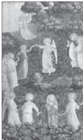
Beato Angelico, «Giudizio universale» (1431, particolare)

«Realmente molti di noi dovrebbero dire: "non vivo, non vivo realmente, perché non vivo l'essenza della mia vita"; il brano tratto da Dottori della Chiesa di Benedetto XVI (Città del Vaticano, Libreria Editrice Vaticana, pagine 93, euro 14) non è una requisitoria sui limiti o sui difetti umani, ma un'indicazione di metodo. Il fil rouge del libro – che raccoglie le catechesi del mercoledì del Papa, riccamente illustrate da quadri, ritratti e, nel caso di santa Teresa di Lisieux, foto d'epoca – è la straordinaria «normalità» dei santi, unita alla febbre di vita che caratterizza ogni attimo della loro esistenza, raggiunta grazie all'intensità e alla concretezza della loro capacità di amare.