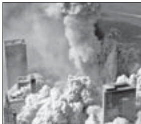
Il crollo delle Torri gemelle a New York

Altre impietose verità – «il mio tema è la guerra e la pietà della guerra», così recita l'epigrafe – la musica, infine, dirà nel monumentale War Requiem opera 66 (1961) di Britten, in quel linguaggio possente e «pacifatore» che il grande compositore inglese le ha insegnato ad articolare nel dilaniato «secolo breve». Britten, che aveva sempre voluto musicare il testo della messa da requiem, in questo caso va ben