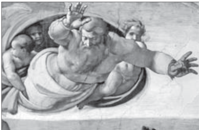
Michelangelo, «Dio separa la terra dalle acque» (particolare della Cappella Sistina)

Battesimo l'immersione in acqua aggiunge al significato di purificazione quello di passaggio dalla morte alla vita. E la sete è un segno della nostra umanità, verso la quale Gesù dimostra piena solidarietà, quando grida «Ho sete» e dopo avere bevuto, muore. L'estrema invocazione umana di Gesù può essere collegata alle parole di Benedetto XVI: «Il diritto all'acqua – scrive il Papa nel Messaggio al direttore generale della Fao in occasione della Giornata mondiale dell'acqua, 22 marzo 2010 – si basa sulla dignità umana (...). Senza acqua la vita è minacciata. Dunque, il diritto all'acqua è un diritto universale e inalienabile».