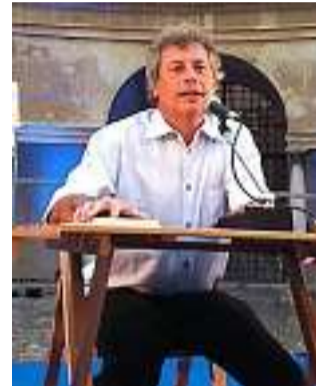
Alessandro Baricco a Mantova

Oggi, dice Baricco, c'è una vera e propria esasperazione della narrazione e assistiamo a una continua scissione dei fatti. A contare sono le storie forti