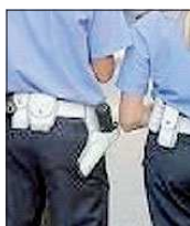
Vigili con la pistola