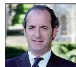
Il ministro Luca Zaia

UDINE «Il governatore del Veneto? Non c'è dubbio, sarà un leghista». Luca Zaia assicura che la Lega «non alzerà l'asticella», che Silvio Berlusconi e Umberto Bossi «non andranno mai allo scontro», che la giunta Galan «ha lavorato bene». Ma il ministro leghista dell'Agricoltura non molla di un centimetro sulla candidatura alle regionali del prossimo anno. La Lega Nord è ritornata ai numeri d'oro del 1996... E Zaia lo spiega così: «Siamo il partito laburista del popolo, interpretiamo appieno il contratto sociale. E, controcorrente rispetto alla storia politica, siamo al governo ma non perdiamo voti. Anzi, ne conquistiamo di più perché diamo risposte concrete ai cittadini».