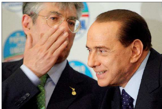
Intesa tra Bossi e Berlusconi contro il voto al referendum: ma Fini non è d'accordo