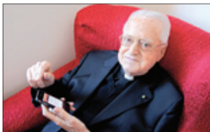
Una delle sue ultime immagini