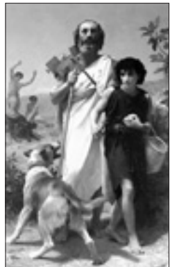
William-Adolphe Bouguereau «Omne e la sua guida» (1874)