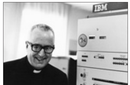
A Roma nel 1973

Tra gli altri contributi del gesuita ricordiamo: Totius Latinitatis Lemmata (Milano, Istituto Lombardo, Accademia di Scienze e Lettere, 1988); Fondamenti di informatica linguistica (Milano, Vita e Pensiero, 1987); Inquisitiones lexicologicae in Indicem Thomisticum (Gallarate-Milano, Edizioni Cael, 1994); Il libro dei