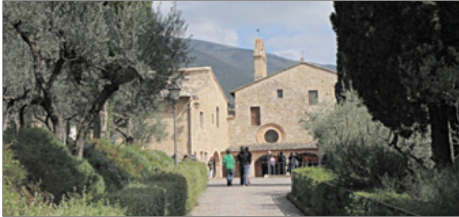
Il monastero di San Damiano ad Assisi

I monasteri vere e proprie oasi dello spirito nelle quali Dio parla all'umanità. Lo ha detto il Papa durante l'udienza generale di mercoledì 10 agosto, a Castel Gandolfo.