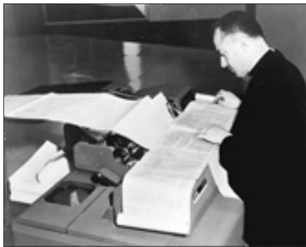
A New York nel 1956

Vicenza da genitori originari di Lusiana, sull'altopiano di Asiago, e più precisamente della contrada Busa, donde il cognome. Il grande studioso, il compilatore dell' Index Thomisticus , è morto di vecchiaia all'Aloisianum, l'Istituto di Gallarate (Varese), dove s'era ritirato a vivere dagli anni Sessanta insieme con i grandi decani della Compagnia di Gesù, fra cui il cardinale Carlo Maria Martini, del quale è stato amico e interlocutore. In precedenza fu per lungo tempo docente alla Pontificia Università Gregoriana e alla Cattolica, nonché, dal 1955 al 2000, al Politecnico di Milano, dove teneva corsi di intelligenza artificiale e robotica. La sua ricerca gli è valsa l'istituzione del Roberto Busa Award, massima onorificenza del settore. Avrebbe compiuto 98 anni il prossimo 28 novembre.