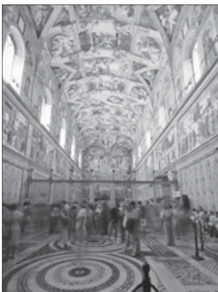
La Cappella Sistina è la meta privilegiata dei visitatori

Consola accorgersi che la valutazione internazionale dei Musei Vaticani resta molto alta. Cultur College, osservatorio straniero che dà il voto alle pubbliche collezioni d'arte