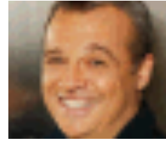
Dov'è mia figlia?

Claudio Valle è un uomo che ha successo nel lavoro e due figli e una moglie bellissimi. Tutto si sgretola quando sua figlia Chiara, una notte, sparisce nel nulla.