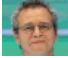
Enrico Mentana presenta: Film Evento