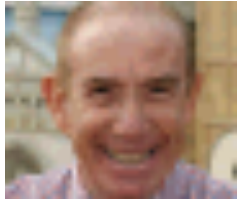
Ricette di famiglia

Il programma all'insegna della tradizione e delle buone ricette di una volta, condotto da Davide Mengacci dai luoghi più suggestivi dell'Italia.