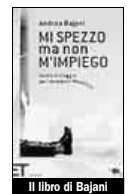
Il libro di Bajani

Complessivamente, l'Italia che viene fuori da questi libri è un paese che viaggia senza una direzione. Molti degli intervistati sono diplomati e laureati. Persone che quando concludono gli studi non hanno nessuna concreta possibilità di ini-