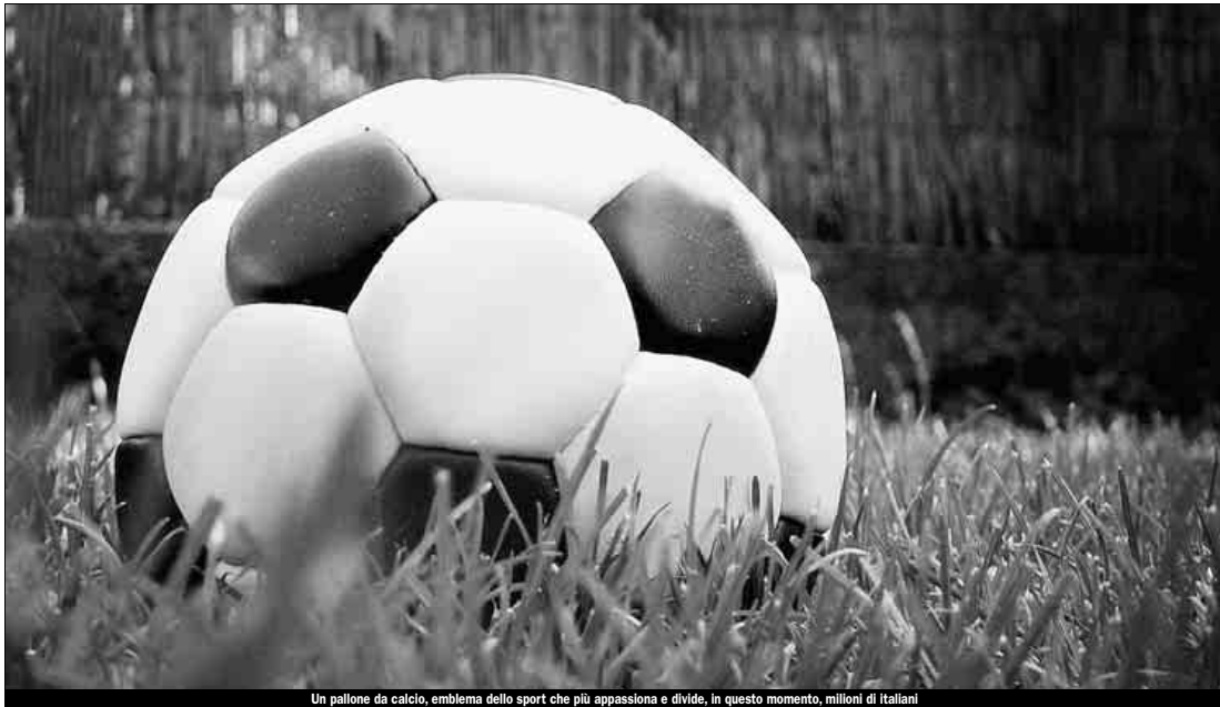
Un pallone da calcio, emblema dello sport che più appassiona e divide, in questo momento, milioni di italiani