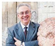
IL LIBRO Stefano Lorenzetto