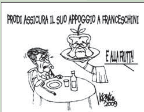
Da Krancic da Il Giornale