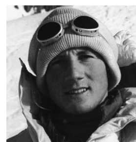
UNA SALITA CHE CONTINUA Gennaio 1954, Walter Bonatti sul Breithorn durante gli allenamenti per la scalata al K2