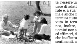
Una famiglia al parco

Con il libro Il terzo escluso , Alici, si propone di ritrovare la meraviglia smarrita dinanzi alla rete delle relazioni con l'altro, cercando di comprendere come cambia il «paesaggio culturale» nell'epoca dei legami cor-