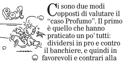
TRE PALLE, UN SOLDO

La cacciata di Profumo mette davvero a rischio l'italianità della più grande banca italiana