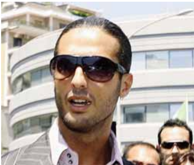
Fabrizio Corona, protagonista del caso Vallettopoli