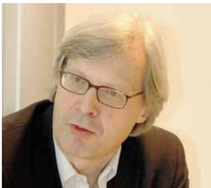
Vittorio Sgarbi, critico d'arte, politico, personaggio tv