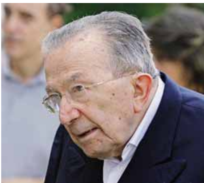
Giulio Andreotti, senatore a vita

la prima metà degli anni Ottanta, Andreotti raccolse in tre libri dallo stesso titolo, Visti da vicino , le memorie degli incontri con i personaggi conosciuti nel corso della sua carriera politica, nient'affatto conclusa considerato che in seguito sarebbe stato ancora per quattro volte ministro e avremmo avuto il sesto e il settimo governo presieduti da lui. (...) Nel mio piccolo ho sempre cercato di praticare la virtù opposta: vederli da lontano. Il più lontano possibile. Esercizio non dei più facili quando finisci a lavorare in un quotidiano nazionale, soprattutto se la sorte ti assegna il compito di fare da vicario a un direttore, Vittorio Feltri, refrattario quanto te alla con-