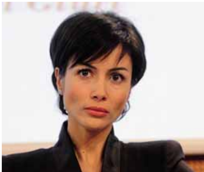
Mara Carfagna, ministro per le Pari Opportunità

Come anticipato a questo giornale da Pier Carlo Orizio, direttore artistico della prestigiosa rassegna, il Progetto giovani è destinato a continuare: «Abbiamo avuto tantissime richieste per replicarlo, con vari suggerimenti, Nostra intenzione è riproporlo, anche Uto Ughi si è dimostrato molto disponibile. È un progetto imprescindibile. Ci auguriamo che anche gli enti pubblici ci seguano». «Il tema principale – ci aveva anticipato ancora il maestro Orizio – ruoterà attorno a Brahms, ma con un'angolatura diversa dal consueto. Non solo la musica orchestrale, ma anche quella da camera, che il Festival potrebbe proporre al più alto livello. Lo potremmo chiamare "L'altro Brahms". Passeremo dalla musica dell'avvenire a un conservatore convinto, che non si volge al '900, ma resta all'inter- no del suo secolo».