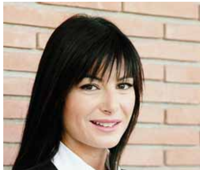
Ilaria D'Amico, conduttrice televisiva