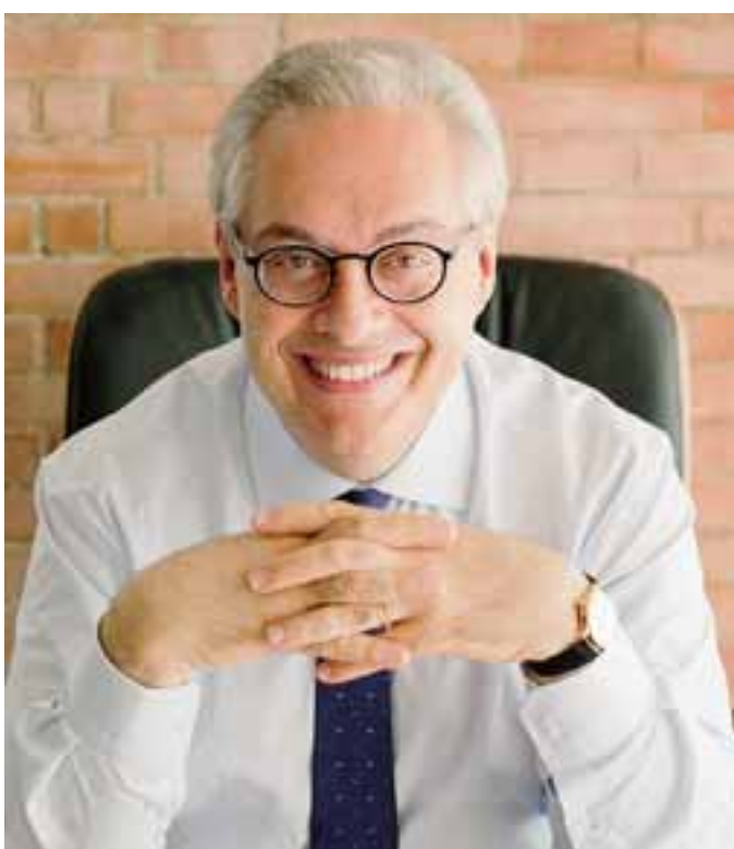
Stefano Lorenzetto, giornalista e scrittore

Forse si tratta solo d'una forma di altruismo interessato, che contempla la clausola della reciprocità. Dopo aver intervistato decine di luminari dell'oncologia, investigato sulle più controverse terapie antineoplastiche e visto morire di cancro molte persone care, mi sono posto l'angoscioso dilemma: che cosa farei, che protocollo di cura sceglierei, qualora venisse diagnosticato a me un tumore inoperabile? la chemioterapia? la radioterapia?