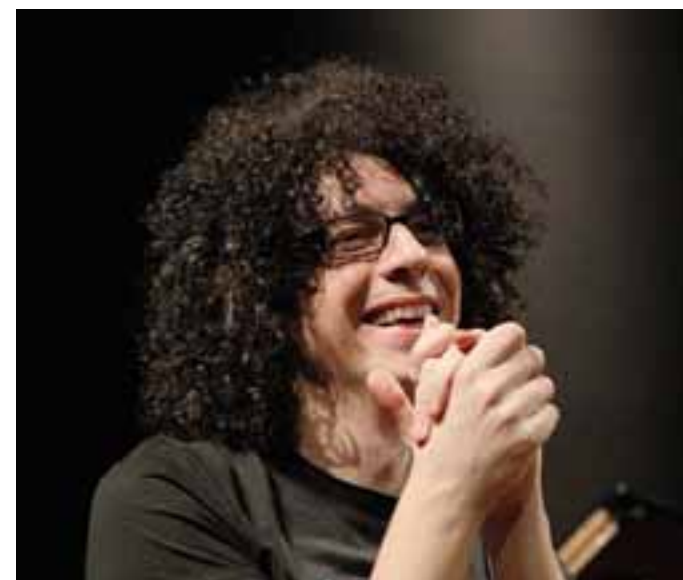
Giovanni Allevi, pianista e compositore