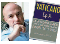
Il saggio-inchiesta di Gianluigi Nuzzi, giornalista di Panorama, «Vaticano S.p.A.» (Chiarelettere, pp. 280, € 15)

Personaggio chiave del libro — da ieri in testa alla classifica dei saggi e ottavo nella Top Ten