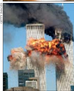
RADICI DA RECUPERARE

Le Torri gemelle di New York l'11 settembre 2001. Sopra, il presidente francese Jacques Chirac.