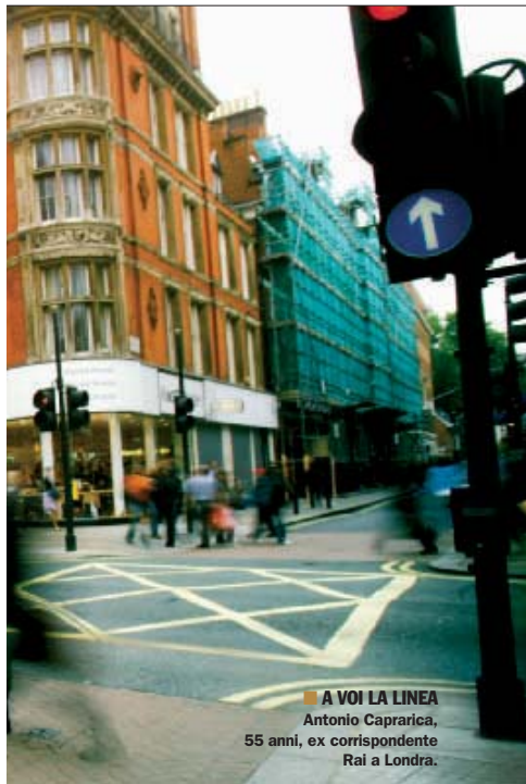
■ A VOI LA LINEA Antonio Caprarica, 55 anni, ex corrispondente Rai a Londra.

Da questo punto di vista Caprarica resta l'unico