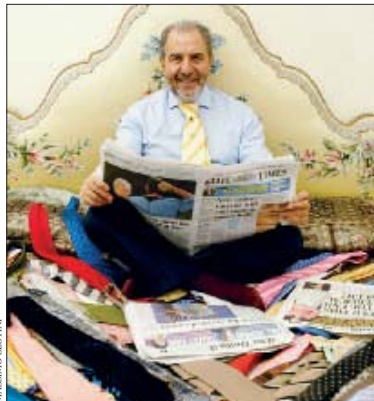
■ NODI MULTICOLOR

Lo è anche architettonicamente, con le colonne doriche che sorreggono il timpano su cui è scolpito il motto del fondatore lord Reith: «Voi ereditate in un tempio delle arti e delle scienze, dedicata alla gloria di Dio e alla diffusione della conoscenza». Ecco, quello sì è un posto dove anche l'ultimo dei cronisti tiene la schiena dritta. ●