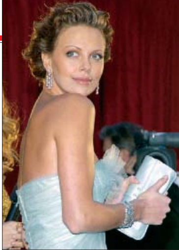
«Molte star di Hollywood prendono in prestito gioielli e poi li restituiscono. A Charlize Theron abbiamo fornito una parure per la serata degli Oscar»

Tutti gioiellieri in famiglia? Tutti. Da tre generazioni. Ha mai pensato di fare un mestiere diverso da questo? Uscito dal liceo classico Torquato Tasso, mi sarebbe piaciuto diventare architetto. Mio padre mi dissuase. Cominciai a lavorare con lui, iscrivendomi a giurisprudenza. Lo accompa-