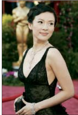
DIAMANTI DA STATUETTA L'attrice Ziyi Zhang e, a sinistra, Charlize Theron con gioielli Bulgari alla serata degli Oscar (la Theron indossava bracciali vintage in diamanti e platino e orecchini di diamanti). Sotto, Selma Blair con gli orecchini fotografati a fianco.

Allora c'era voglia di vivere. Uscivamo da una guerra. Oggi ci siamo entrati, e non solo per effetto dell'11 settembre. Il mondo è cambiato.