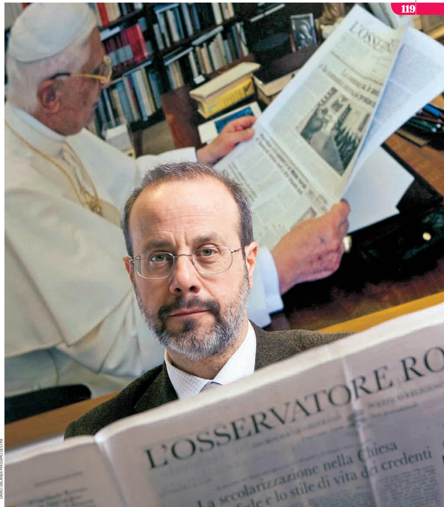
DARIO ORLANDI/MASSIMO SESTINI