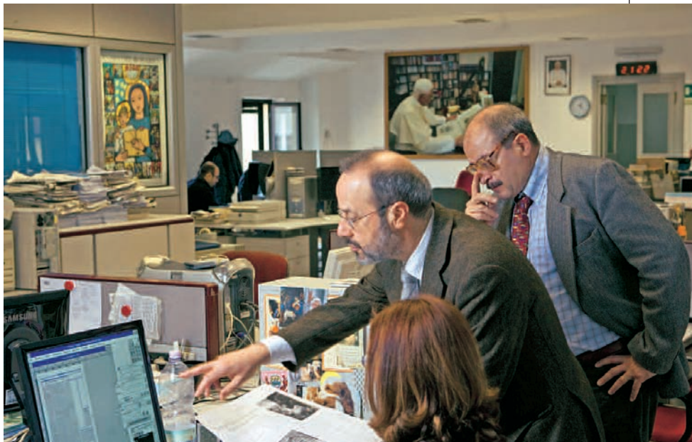
DARIO ORLANDI/MASSIMO SESTINI

Vian in redazione: «L'Osservatore» chiude in tipografia alle 14.