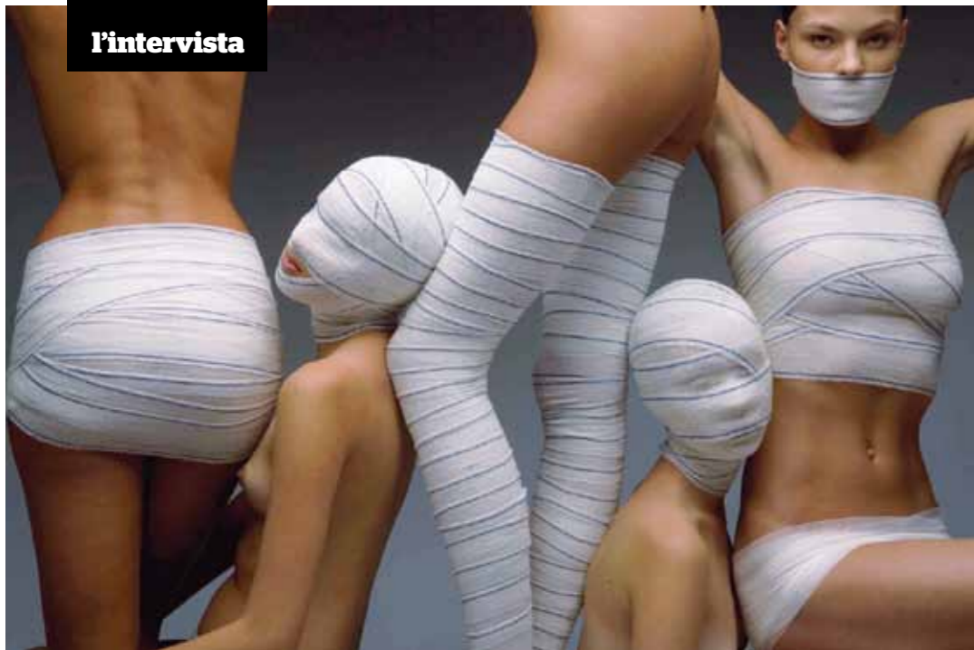
Quel che non si vede Per celebrare i sessant'anni di Elle France (2007) Toscani ha fotografato le "nuove" donne, quelle che non hanno più bisogno di mostrarsi.