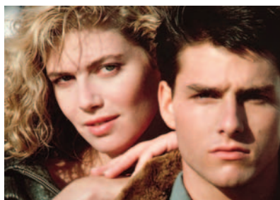
Kelly McGillis con Tom Cruise in «Top Gun»

Non si limitava a fare la televisione: la guardava. Una sera gli portai a cena lo scrittore Sandro Veronesi