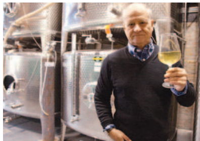
Thoulouze nella cantina in cui nasce l'Orto

Finanziava gli algerini. Mio padre lo combatteva e mi giurò che a Bascapè non ci fu un attentato