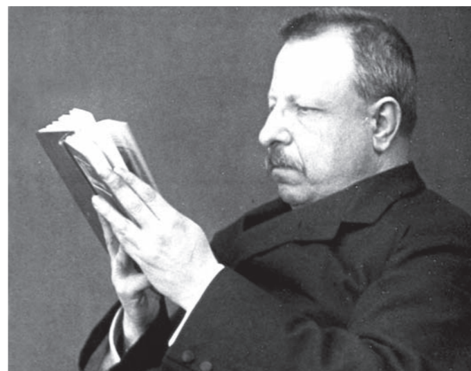
INNO SUBLIME Il filosofo non credente Benedetto Croce nel 1947 invocò lo Spirito Santo sulla Costituzione: «Mentes tuorum visita...»

Già spendiamo 900 mila euro l'anno per l'affitto dei tre satelliti con cui trasmettiamo dagli Usa all'Australia. Adesso ci tocca buttar via tutte le apparecchiature dell'analogico, l'ultima acquistata due mesi fa: sono ferro vecchio