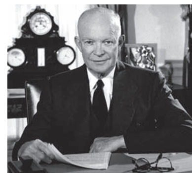
Dwight Eisenhower: «Atoms for peace»

Dissentito dalla Prestigiacomo. Non sono affatto convinto che a surriscaldare il pianeta siano i gas serra. Presto salteranno fuori tutte le vergogne dell'Ipcc