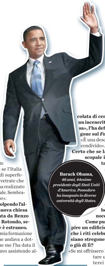
Barack Obama, 48 anni, 44esimo presidente degli Stati Uniti d'America. Pomodoro ha insegnato in diverse università degli States.

mo di Cefalù. «No, quello me l'ha bloccato Vittorio Sgarbi quand'era sottosegretario ai Beni culturali. Pare che un monumento normanno del 1200 non debba essere contaminato dall'arte contemporanea. Come se l'Italia non fosse rigurgitante di superfetazioni. Basti vedere le vetrate che un artista palermitano ha realizzato per quella stessa cattedrale. Sembrano un film in technicolor».