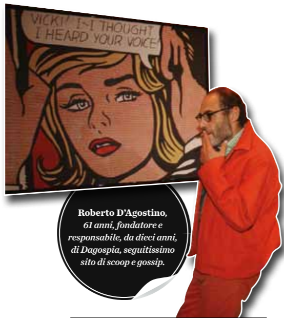
Roberto D'Agostino, 61 anni, fondatore e responsabile, da dieci anni, di Dagospia , seguitissimo sito di scoop e gossip.