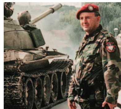
Arkan, capo delle Tigri, morto nel 2000

Mentre ripulivo il museo Correr, il mio complice mi rivelò che le tele del Bellini sarebbero finite al criminale serbo. Scesi in una cabina e telefonai al 113