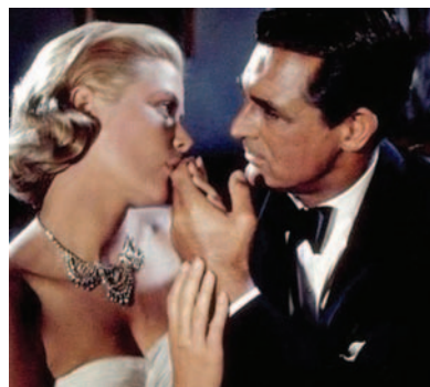
Cary Grant, il Gatto, in «Caccia al ladro»

Mi fece sottrarre una Madonna per trattare con lo Stato e far scarcerare un cugino. Non deve essere bastato, perché trafugò anche il mento di Sant'Antonio