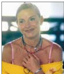
CONTRASTO (3) - GIOVANNA DI