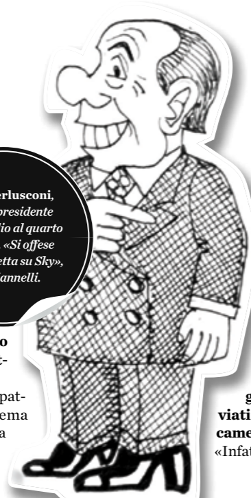
Silvio Berlusconi, 73 anni, presidente del Consiglio al quarto mandato. «Si offese per la vignetta su Sky», dice Giannelli.