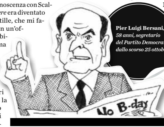
Pier Luigi Bersani, 58 anni, segretario del Partito Democratico dallo scorso 25 ottobre.