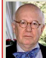
Roberto Gervaso Anche storico e scrittore, Gervaso, 73, annovera interviste da Moana Pozzi a Padre Sorge.

Gianni Minà Anche scrittore e conduttore tv, Minà, 72, ha intervistato i testimoni del nostro tempo, dal campione di ciclismo Gino Bartali allo scrittore e regista cileno Luis Sepulveda.