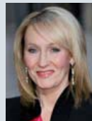
La scrittrice inglese J.K. Rowling, 45; a sinistra, il bacio tra il «maghetto» Daniel Radcliffe, 21, e Bonnie Wright, 19.

notevole del suo autore, scritta tra il 1909 e il 1922 e pubblicata in sette volumi tra il 1913 e il 1927. Comprende quasi 10 milioni di caratteri e una media (che varia in base alle edizioni e alle lingue) di 4.000 pagine.